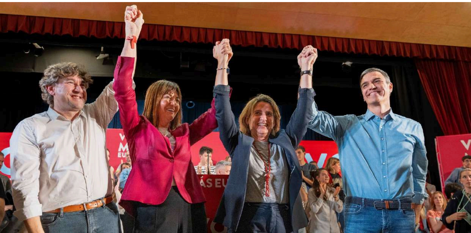
Acto en Barakaldo con Pedro Sánchez