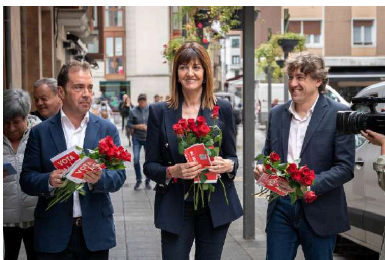
Reparto electoral en Ermua