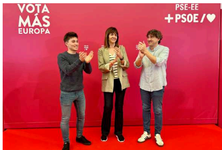
Acto en Bilbao con JSE-Egaz