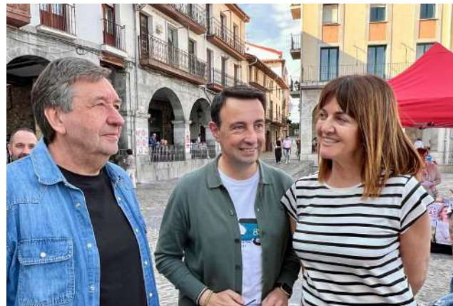
Acto en Castro Urdiales