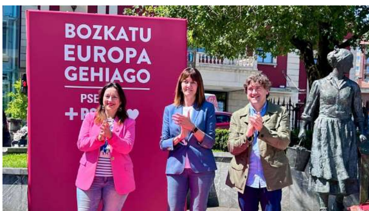
Acto en Basauri