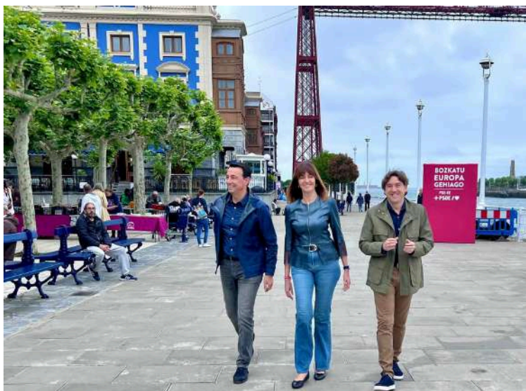
Acto en Portugalete