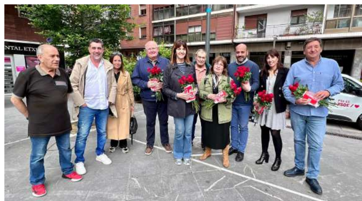
Reparto electoral en Erandio