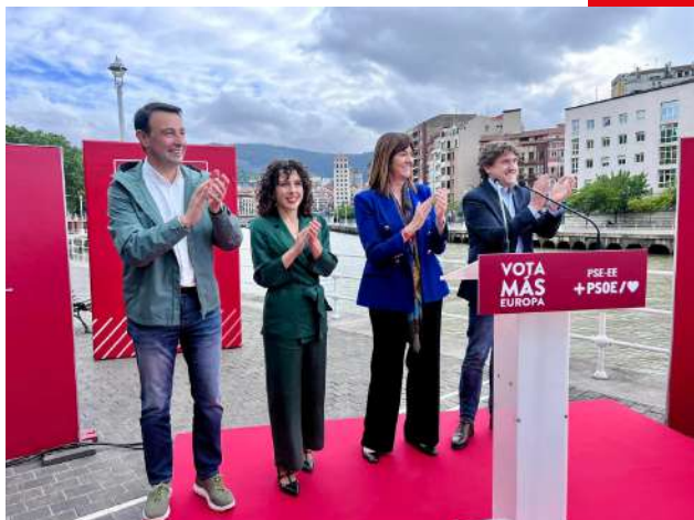
Inicio de campaña en Bilbao