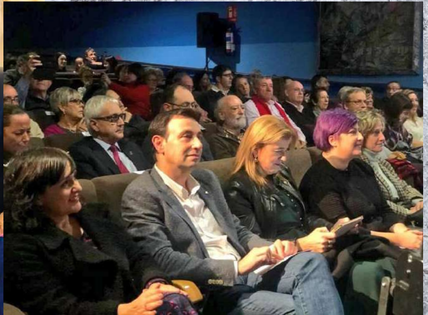
Premios Lentxu Rubial por la Igualdad