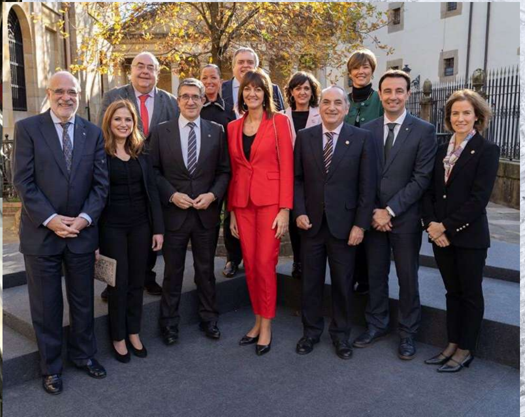
Homenaje a Lehendakaris en el exilio