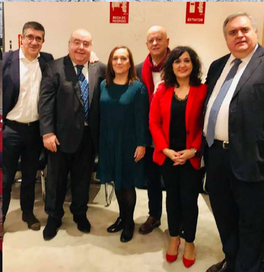
Constitución de las Cámaras