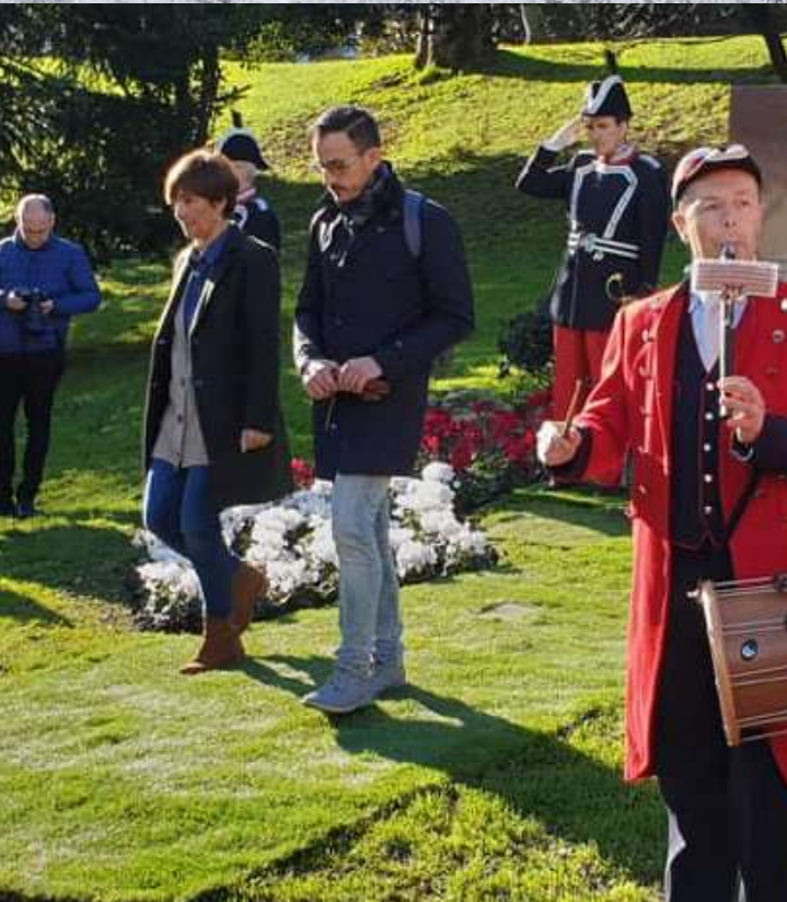
Ofrenda floral a las víctimas del terrorismo