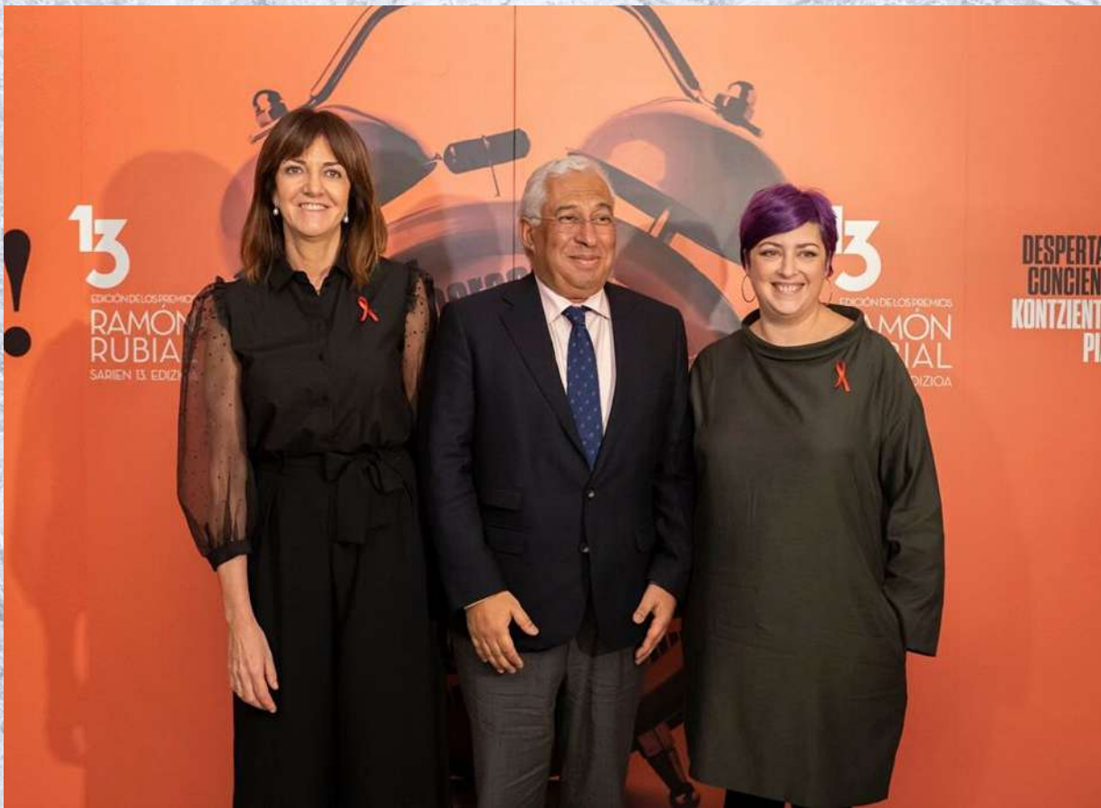
XIII Entrega Premios Ramón Rubial