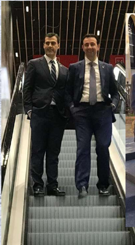
Inauguración de Bilbao Intermodal