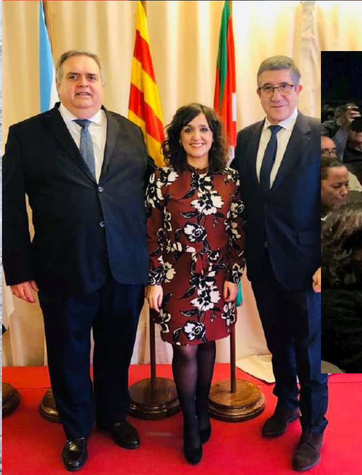
41 aniversario de la Constitución