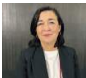
YOLANDA DÍEZ SALUD PÚBLICA Y CONSUMO