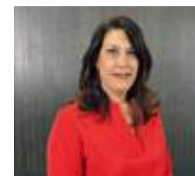
ITZIAR UTRERA JUSTICIA Y SEGURIDAD CIUDADANA