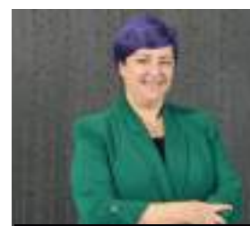
EIDER GARDIAZABAL UNIÓN EUROPEA Y ACCIÓN EXTERIOR