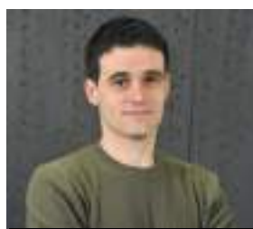
VÍCTOR TRIMIÑO TRANSICIÓN ECOLÓGICA Y CAMBIO CLIMÁTICO