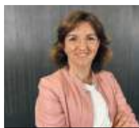
NELI SANTOS ESTUDIOS Y PROGRAMAS