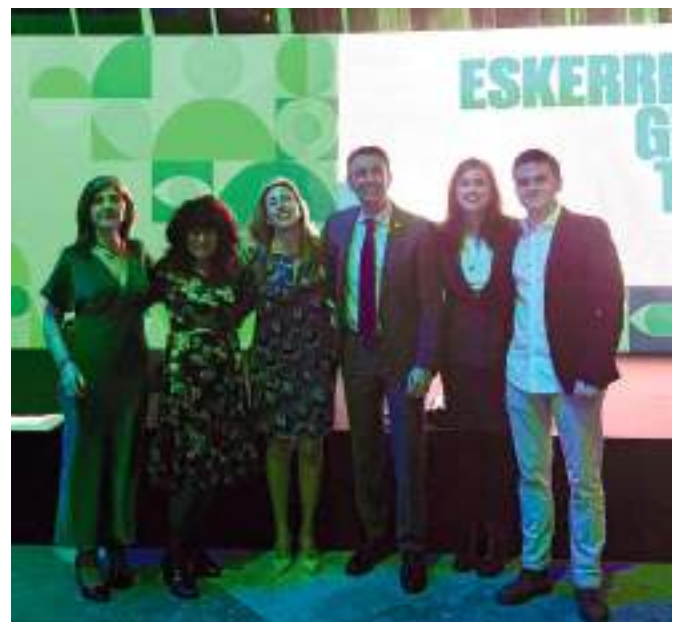
30 ANIVERSARIO DE ACLIMA