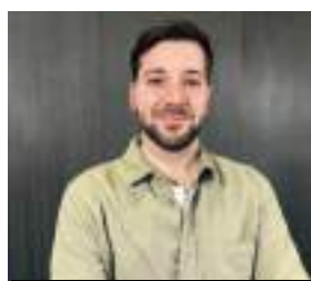
JUAN ROMERO EDUCACIÓN, CULTURA Y UNIVERSIDAD