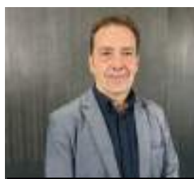
TXITXO ABASCAL VIVIENDA Y AGENDA URBANA