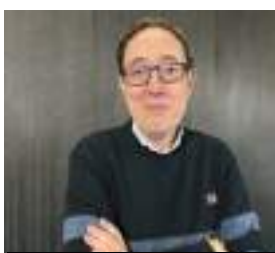
JESÚS GARCÍA DE COS TRABAJO, ECONOMÍA SOCIAL Y AUTÓNOMOS