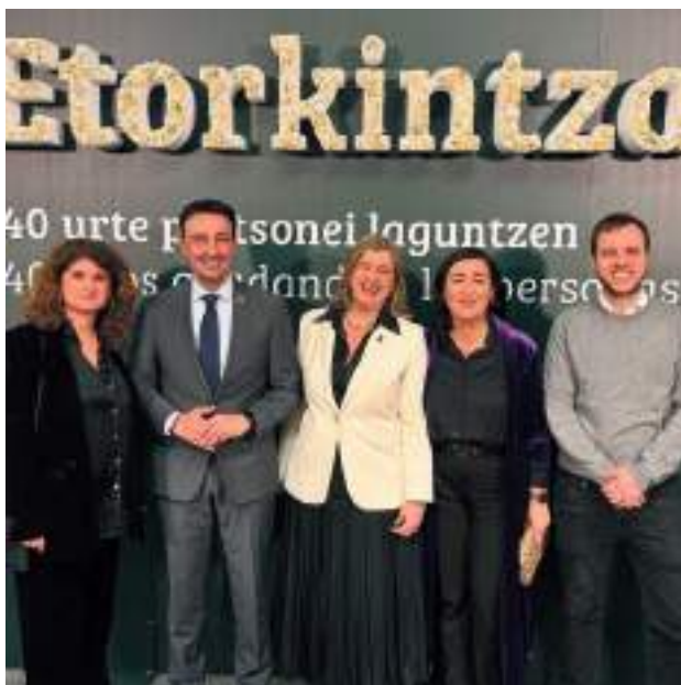
40 ANIVERSARIO DE LA FUNDACIÓN ETORKINTZA