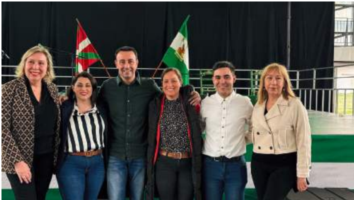
XXI DÍA DE ANDALUCÍA EN EUSKADI, CELEBRADO EN DURANGO