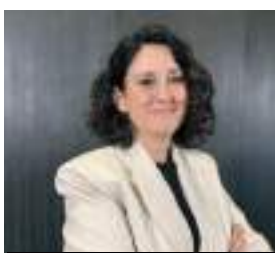
EIDER BILBAO MOVIMIENTOS SOCIALES Y DIVERSIDAD