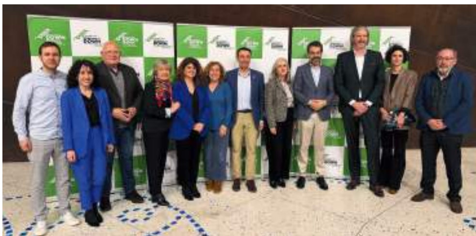
FUNDACIÓN SÍNDROME DE DOWN DE EUSKADI, XIII DESFILE DE MODA