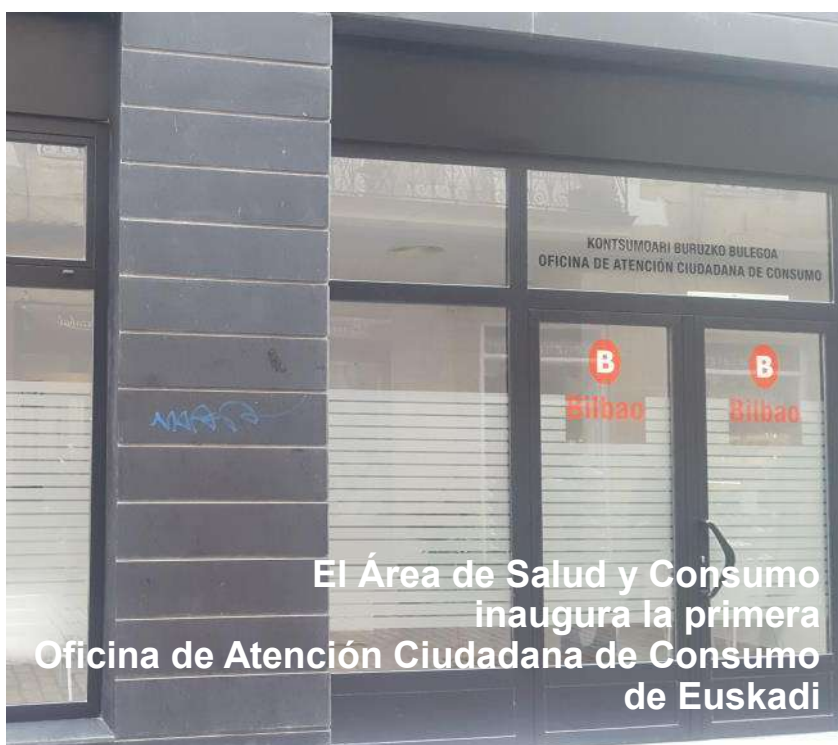
El Área de Salud y Consumo inaugura la primera Oficina de Atención Ciudadana de Consumo de Euskadi

Más de 23 millones de personas utilizaron durante 2017 alguno de los 35 ascensores municipales gratuitos que funcionan en Bilbao