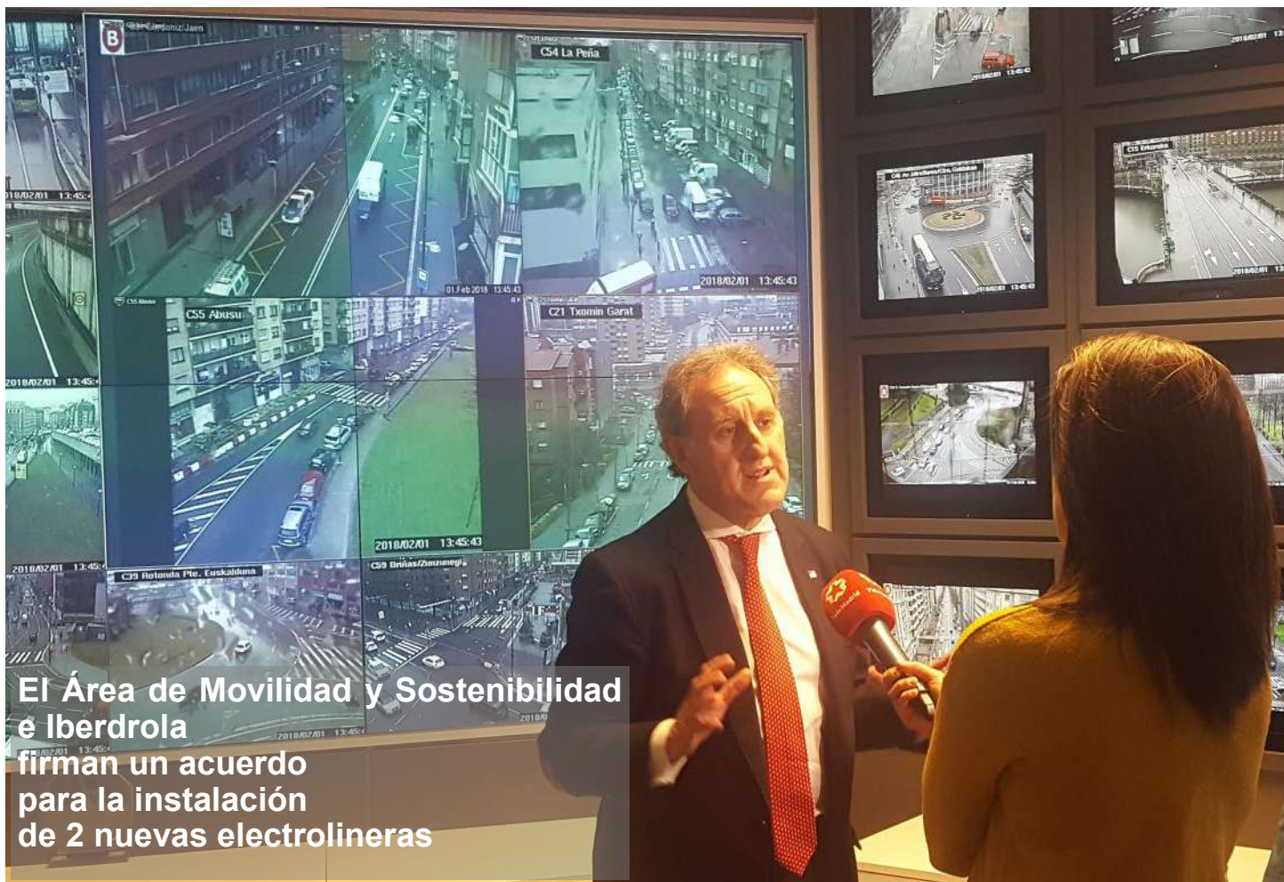
El Área de Movilidad y Sostenibilidad e Iberdrola firman un acuerdo para la instalación de 2 nuevas electrolineras