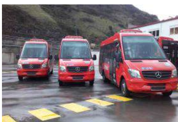
Tres nuevos microbuses se suman a la flota de Bilbobus